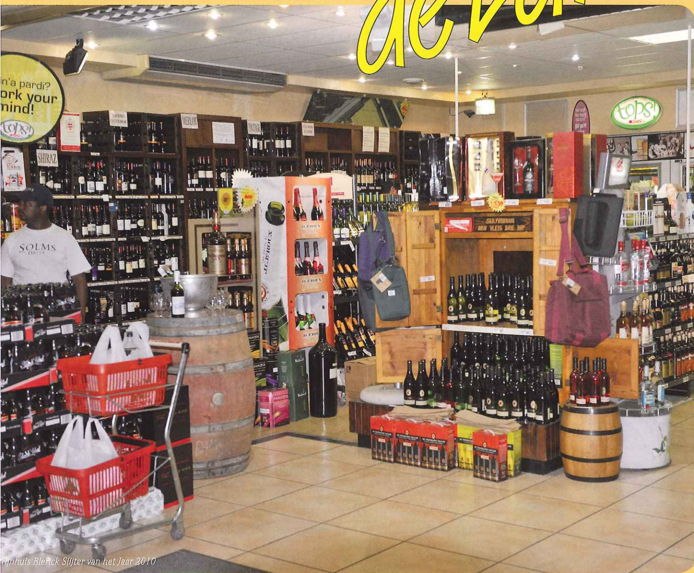
Wijnhuis Bierick Slijter van het Jaar 2010