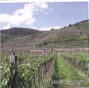
Voi steile hellingen