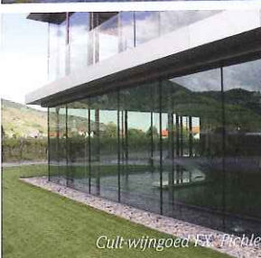
Cult wijngoed FX Pichler