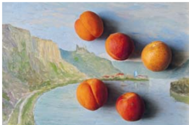
2009 Pfaffenberg riesling Auslese, Knoll - Unterloiben

Mein Tipp für mehr Abwechslung: Der beschriebene Topfteig eignet sich für jede Art von Fruchtknödeln. Damit lassen sich auch herrliche Pfirsich-, Erdbeer- oder Zwetschkenknödel zaubern.